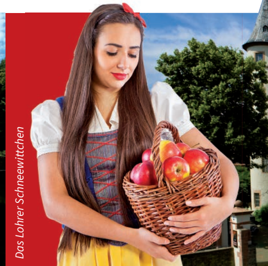
Das Lohrer Schneewittchen