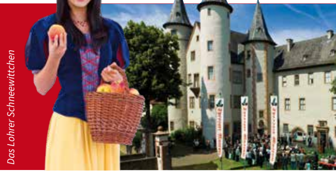
Das Lohrer Schneewittchen