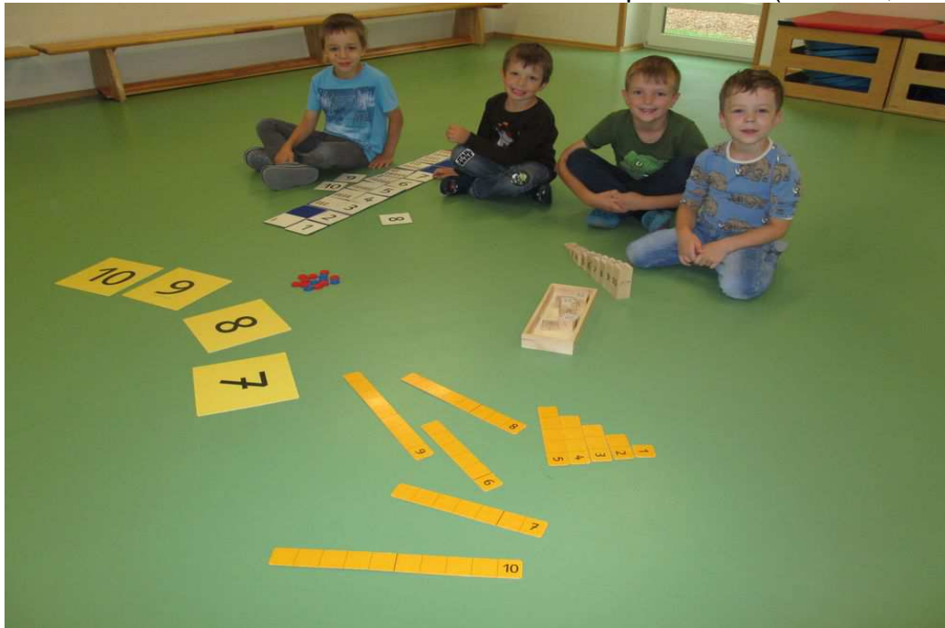
Mathematische Grundprinzipien im Alltag entdecken