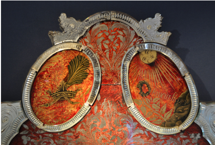
Abb. 2: Im rechten oberen Medaillon der Rahmung des "sprechenden Spiegels" (nach 1713) ist deutlich "Amour Propre" zu lesen.