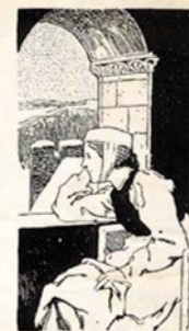
Die Mutter von Schneewittchen.