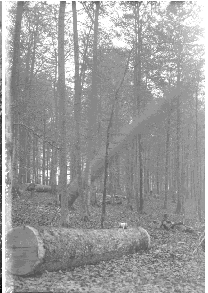
Holzernte um 1930