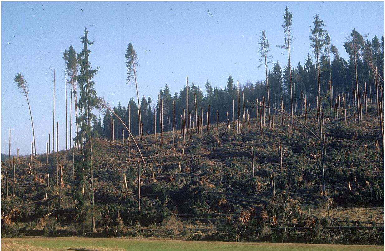
Durch Wiebke zerstörter Fichtenbestand bei Merklingen, Alb-Donau-Kreis

Der Anbau von Laubholz wird vorangetrieben. Zukünftig sollen Mischbestände aus Nadel- und Laubholz eine nachhaltige Forstwirtschaft ermöglichen.