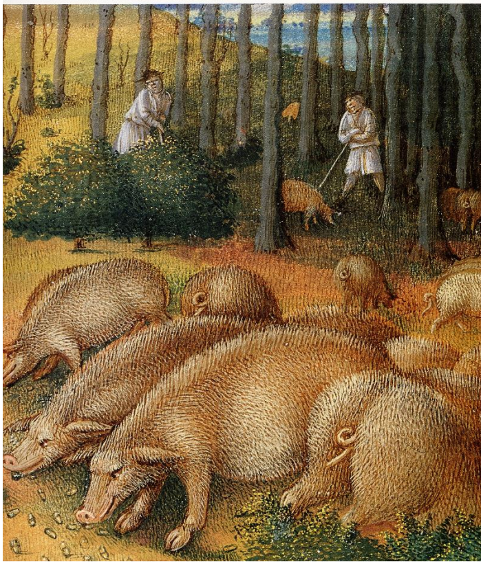
Schweinemast mit Eicheln und Bucheckern 15.Jh. (Detail aus dem Monatsbild November, Les Très Riches Heures, Stundenbuch des Herzogs von Berry, Ms.65 Musée Condé, Chantilly)

Als „Allmende – Wald“ (Gemeinschaftswald) von staatl. Förstern des Landesherren