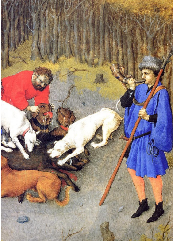
Eberjagd 15.Jh. (Detail aus dem Monatsbild Dezember, Les Très Riches Heures, Stundenbuch des Herzogs von Berry, Ms. 65 Musée Condé, Chantilly)