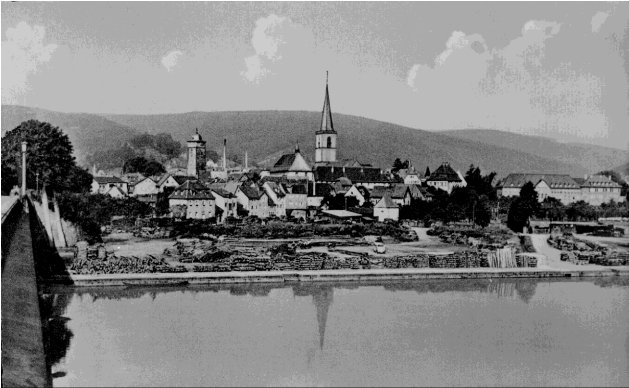
Mainlende als Holzumschlagsplatz für die Verschiffung

Die Forstwirtschaft soll viel Holz in kurzer Zeit produzieren. Das Wirtschaftswunder ist im vollen Gange. Die Industrie benötigt den Rohstoff Holz.