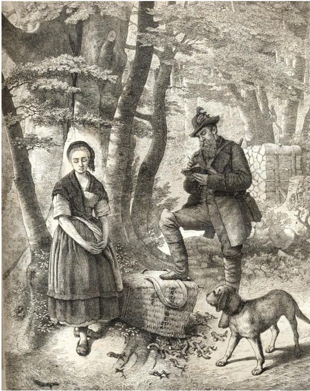
Forstfrevel - Illustration aus der Zeitschrift Gartenlaube um 1870