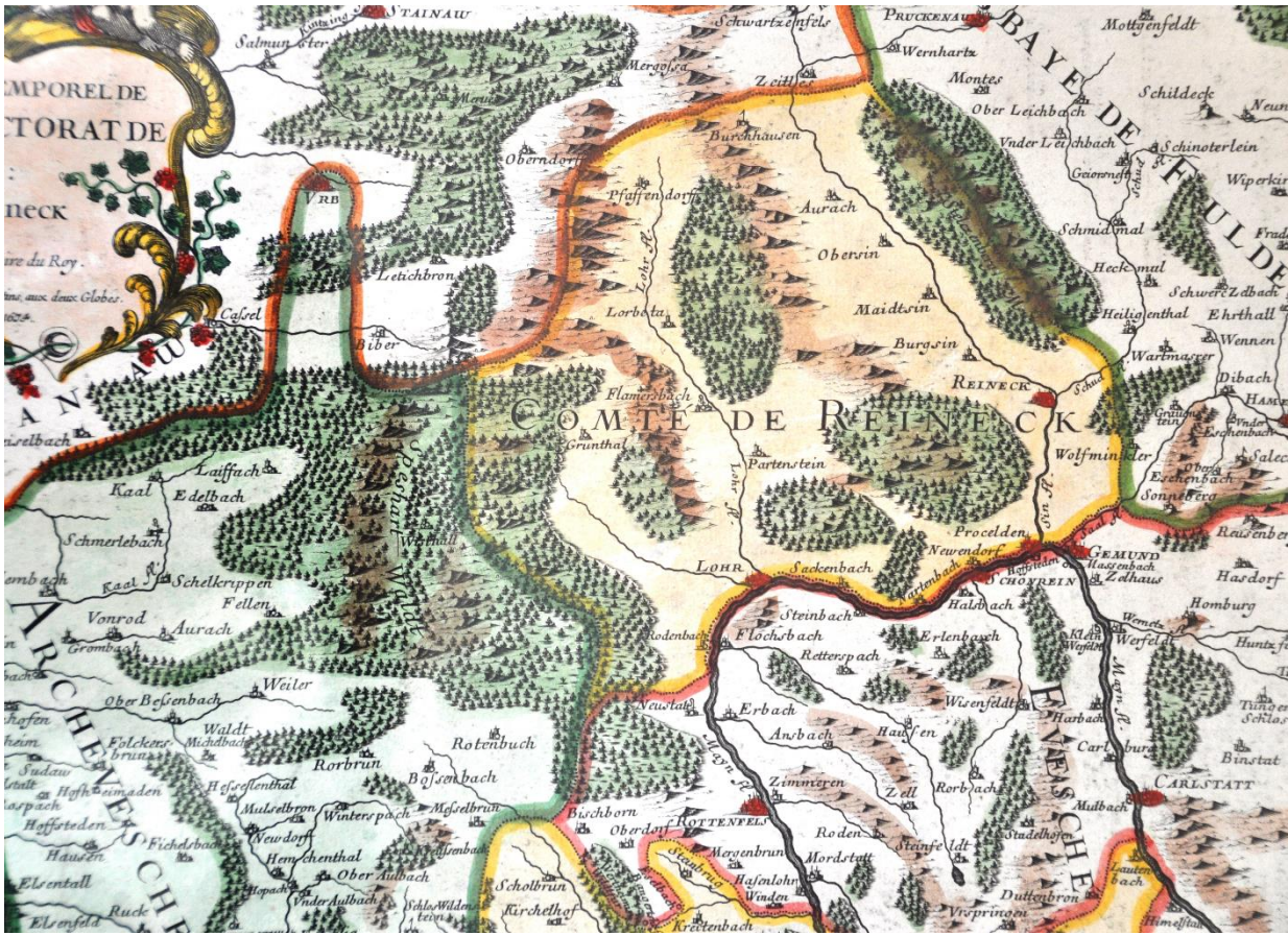
Karte ehem. Grafschaft Rieneck - kolorierter Kupferstich aus Frankreich 1694